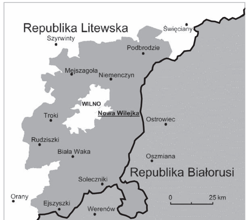
1988 m. brėžtos Vilniaus krašto autonomijos ribos.

ir atsakomybės organizuotos grupės, veikiančios po tautinių mažumų partijų vėliavomis, įgyvendina neaiškius savo tikslus, palaikydamos kontaktus su priešiška nusiutekusiomis grupėmis už šalies ribų, o destruktinės jų žiniasklaidos priemonės nebaudžiamai finansuojamos iš užsienio ir valstybės biudžeto. Šalies ir sostinės koalicijos su asmenimis, nuolatos pažeidžiančiais įstatymus ir pagrindines piliečių laisves bei teises, jau tapo įprastas reiškinys. Ir nieko nebestebina, kad G. Kirkilas „įsteigė“ Balstogės universiteto filialą, kuris veikia didindamas dezintegraciją ir rengdamas jaunos darbo jėgos rezervą Lenkijai.