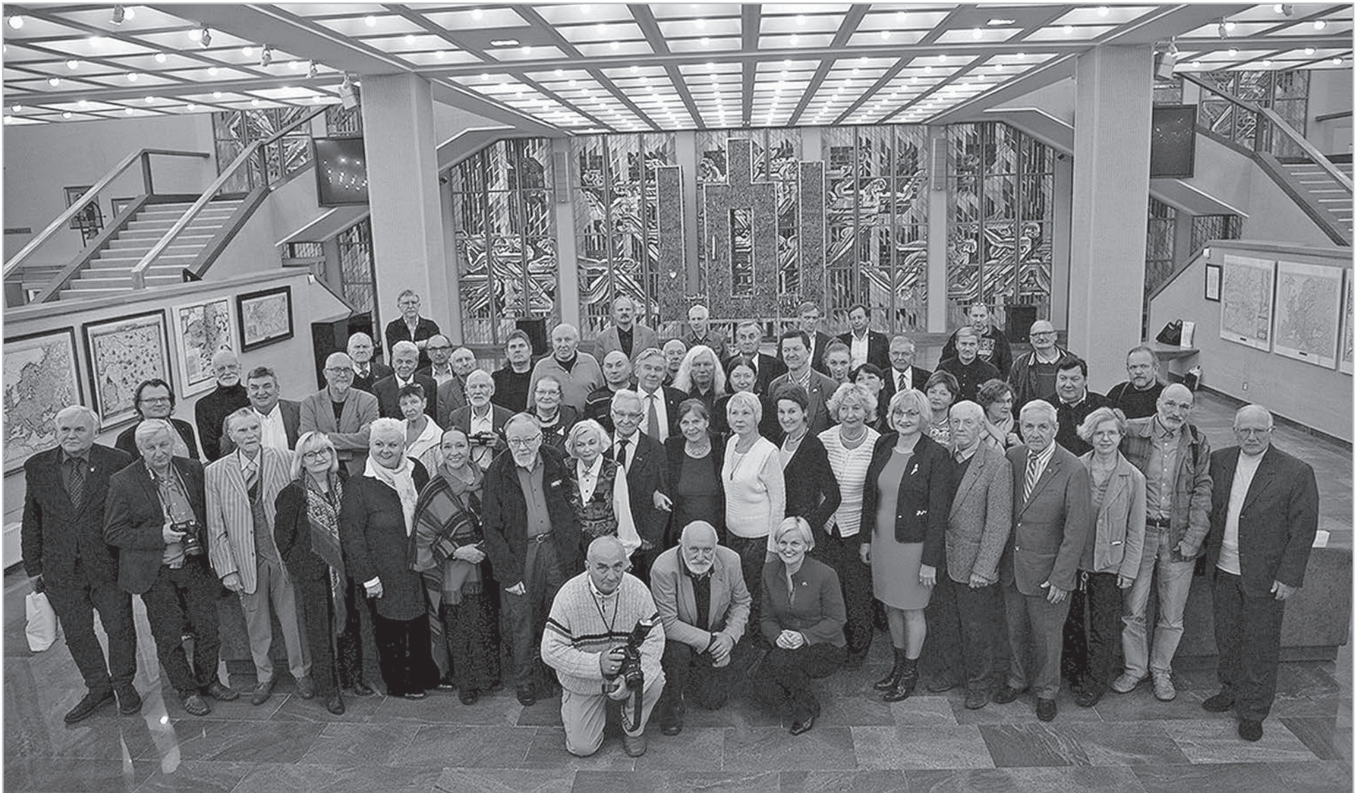
2018 m. rugsėjo 26 d. Seimo rūmuose renginyje „Vizualinė Sąjūdžio istorija: pamatyti nematomą“ susitiko, diskutavo, dalijosi prisiminimais 1988–1990 metų Sąjūdžio fotografai ir žurnalistai. Ne vienas jų simboliškai ir nuoširdžiai parėmė „Sąjūdžio Atgimimo“ išleidimą.