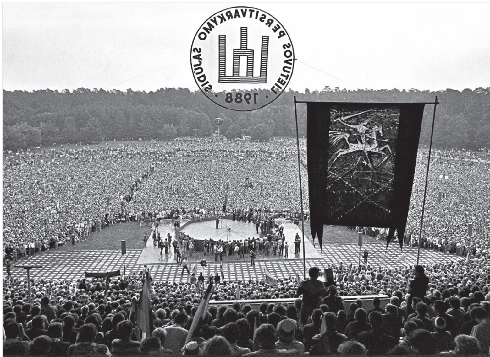
Rugpjūčio 23 dieną Vingio parke Lietuvos Persitvarkymo Sąjūdžio pakviesti susirinko apie 250 000 žmonių iš visos Lietuvos ir kalbėjo apie istorijos tiesą...

Lietuvos Persitvarkymo Sąjūdžio, savaitraščio „Atgimimas“ 30-mečiui ir Romualdo Ozolo gimimo 80-mečiui paminėti