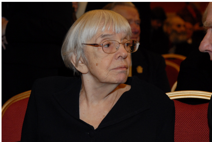
Maskvos Helsinkio grupės atstovė Liudmila Aleksejeva