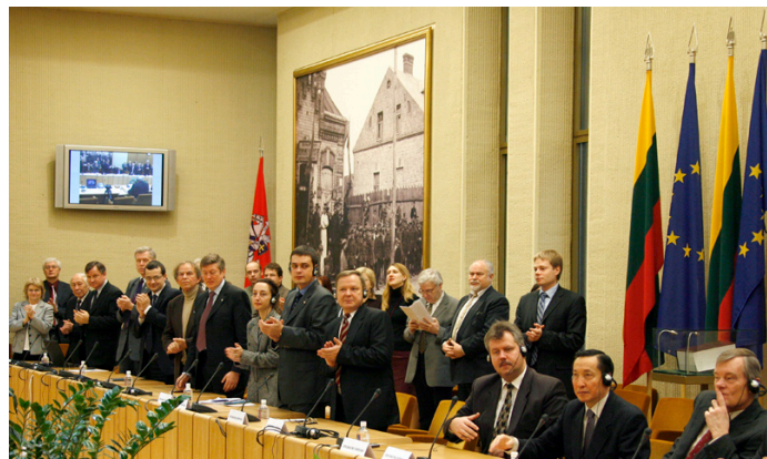
Konferencija prasidėjo LR Seimo Konstitucijos salėje