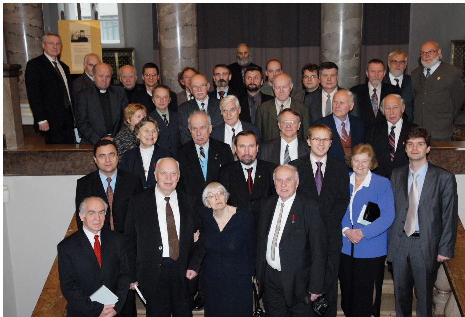
Lietuvos Helsinkio grupės steigėjai, grupės nariai, rėmėjai ir užsienio šalių Helsinkio grupių atstovai