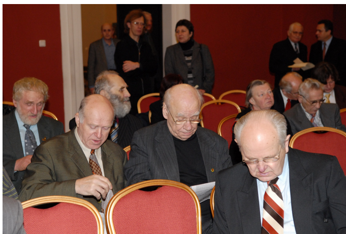
Po knygos pristatymo