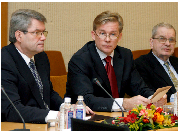
LR Seimo pirmininkas Viktoras Muntianas, LR Seimo narys Audronis Ažubalis, Lietuvos Helsinkio grupės signataras profesorius Tomas Venclova