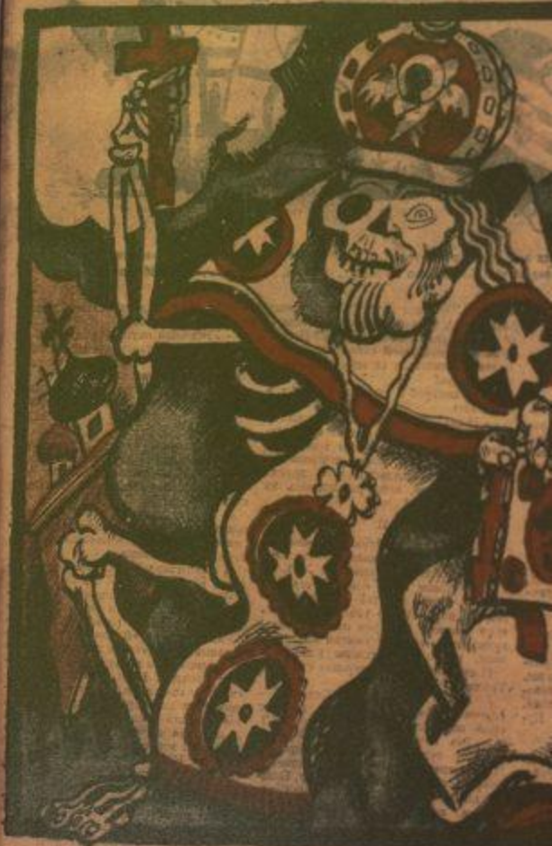
Сей рисунок провозглашение отчая церкви лешей—Талку и Антонику «Ир...