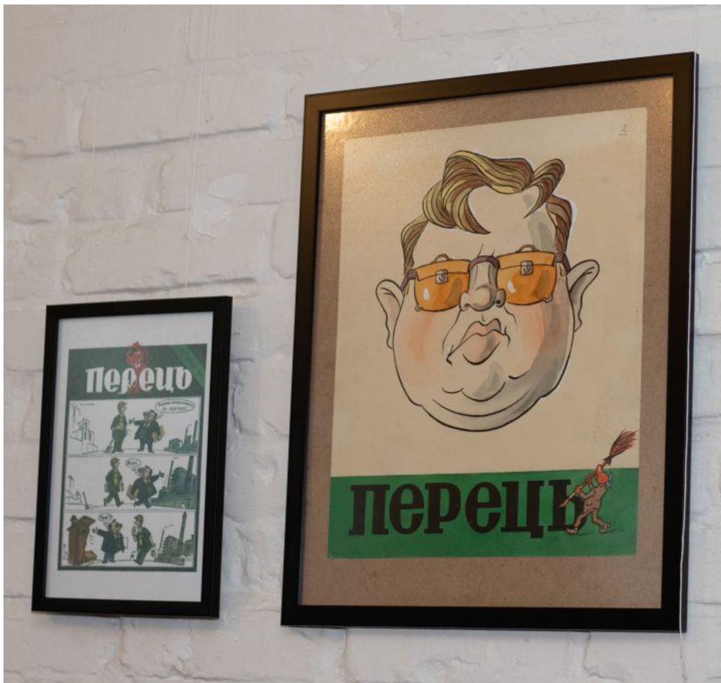
Parodoje pristatomi originalūs piešiniai, kurie buvo publikuoti žurnaluose „Perec“ ir „Krokodil“.