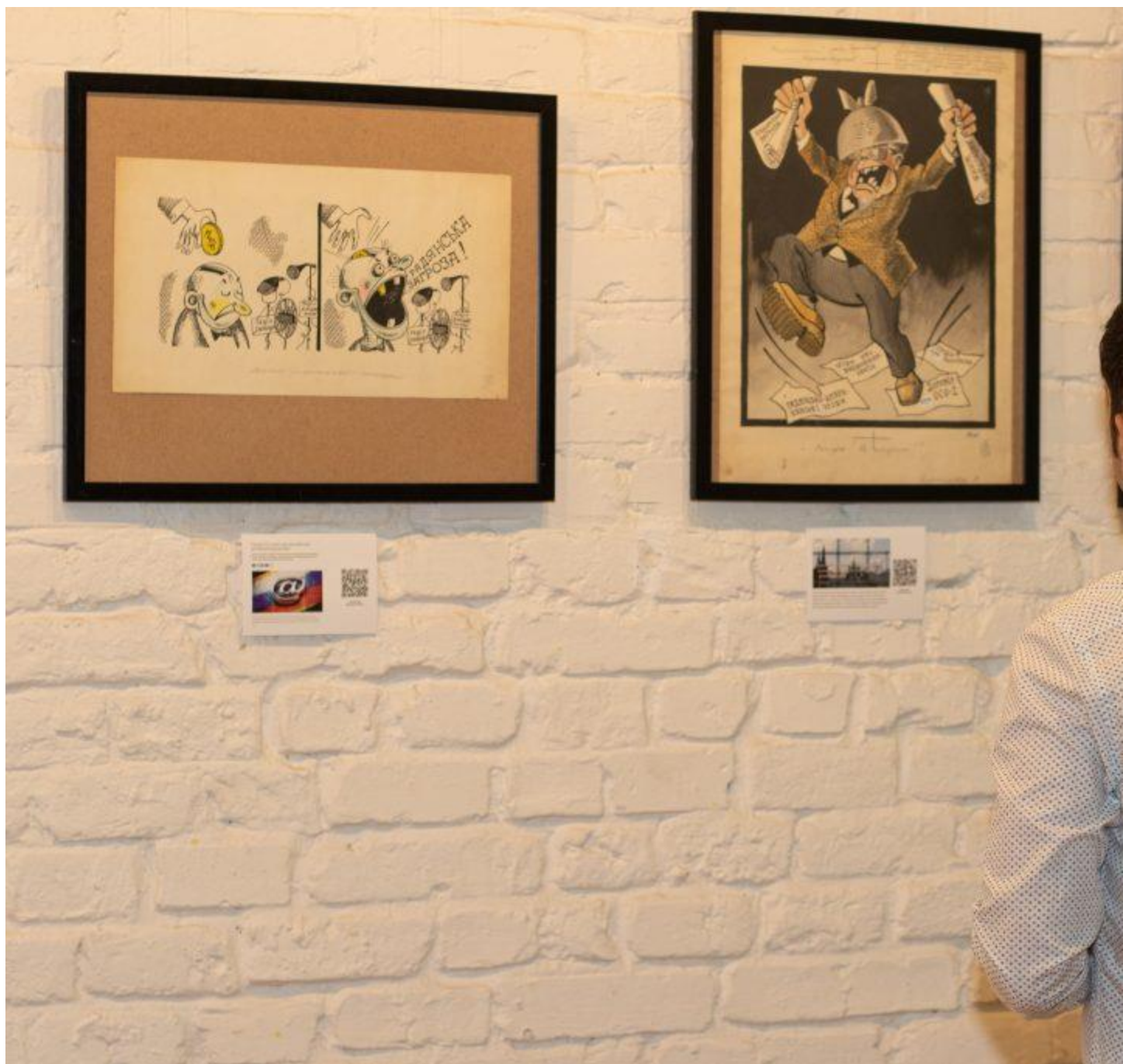
Nepaisant metų, rusų galvose vėl įsitvirtino Vakarų baimė.