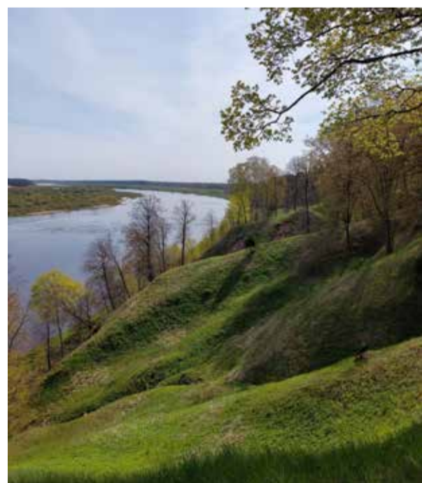
Statūs Sudargo piliakalnių šlaitai, apačioje - Nemunas.

Skarota eglė įkandin murmėjo — Žmogau žmogau, laimingas gi esi, Juk tokios gražios Joninės atėjo, Pabūk ilgiau trumpiausioje naktį.