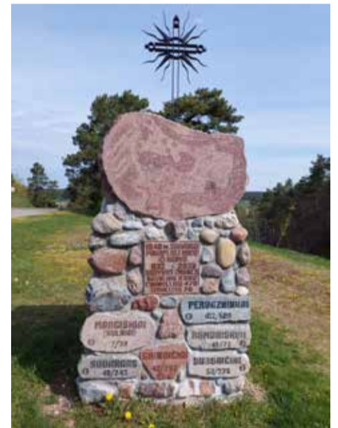
Paminklas Sudargo (Šakių r.) apylinkių kaimams atminti.

Toli Urale slepiasi sužvėrėję Carai nauji vilkolakių veidais. Tai jie nelaimės, mirtį bombom sėja, Paženklinti išlikti prakeiktais.