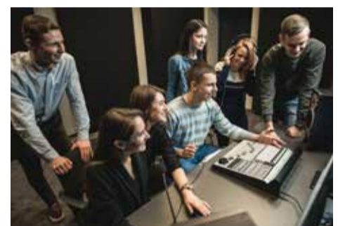
VGTU studentai.

Mūsų universitetas jau kitais metais taps tarptautinių kūrybinių kino dirbtuvių „Vasaros media studija“ partneriu. Studentai turės galimybę įsiliesti į tarptautinių filmavimo komandų darbą Neringoje, kurdami