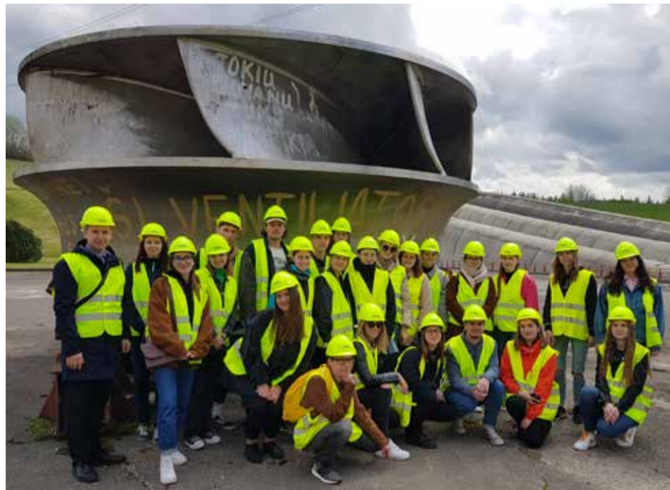
Studentų – būsimųjų aplinkosaugos specialistų praktika

Sudėtingoms aplinkos apsaugos situacijoms valdyti reikia optimalių mokslu ir geriausia praktika grįstų sprendimų, derinančių aplinkosaugos, ekonominius ir socialinius visuomenės vystymosi aspektus.