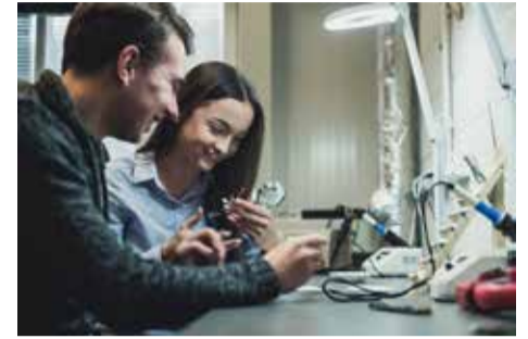
VGTU studentai – būsimieji robotų kūrėjai

nologijoms vystantis, jų trūkumas tik didės. Todėl specialistus reikia rengti dabar. Tam skirta tarpkryptinė inžinerinė studijų programa – Taikomasis dirbtinis intelektas . Studijų programos universalumas suteikia galimybę suvokti DI algoritmų pritaikomumą, ugdo studentų gebėjimą taikyti mašininio mokymo ar vaizdų atpažinimo žinias, projektuojant ir kuriant naujus intelektinius produktus, priimančią pažangius sprendimus ateities gamyboje.